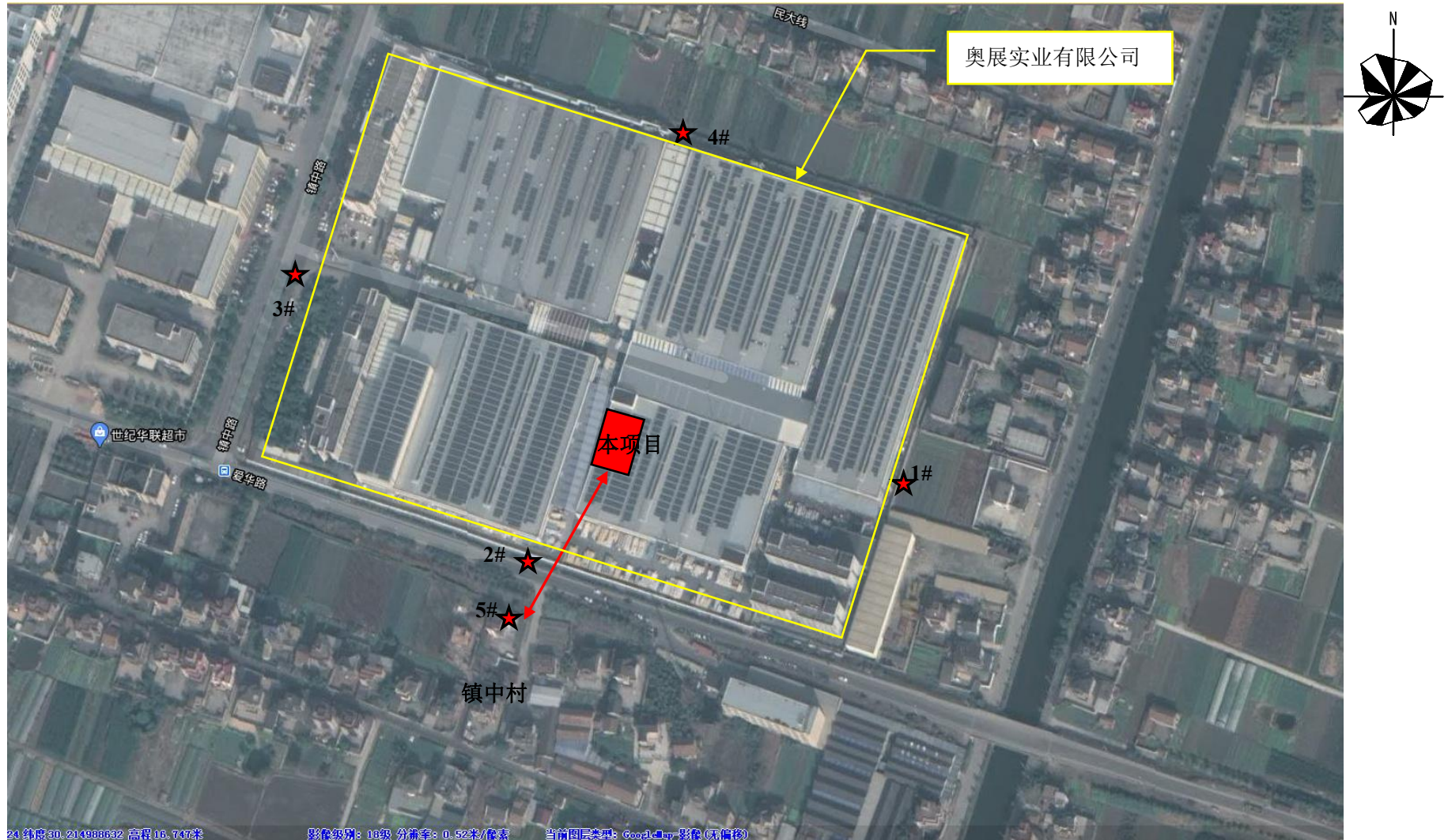
图 3-2 四周环境概况图(含噪声监测点)