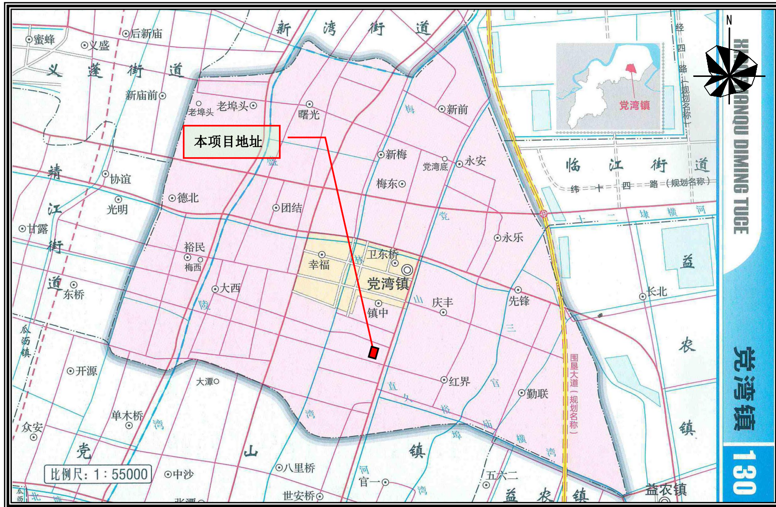
附图1 本项目地理位置图